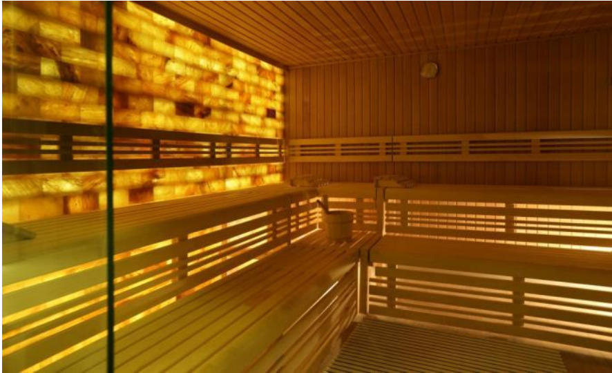
Himalaya Salzwannd Sauna