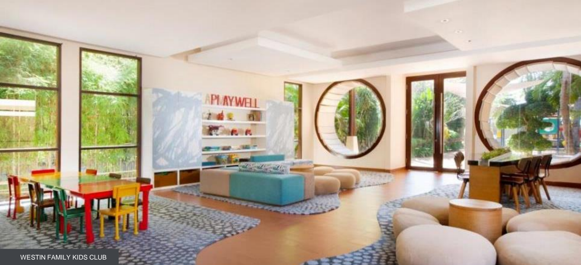
WESTIN FAMILY KIDS CLUB