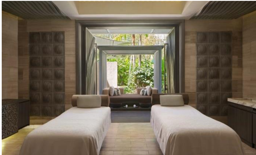
Treatment Room für Paare