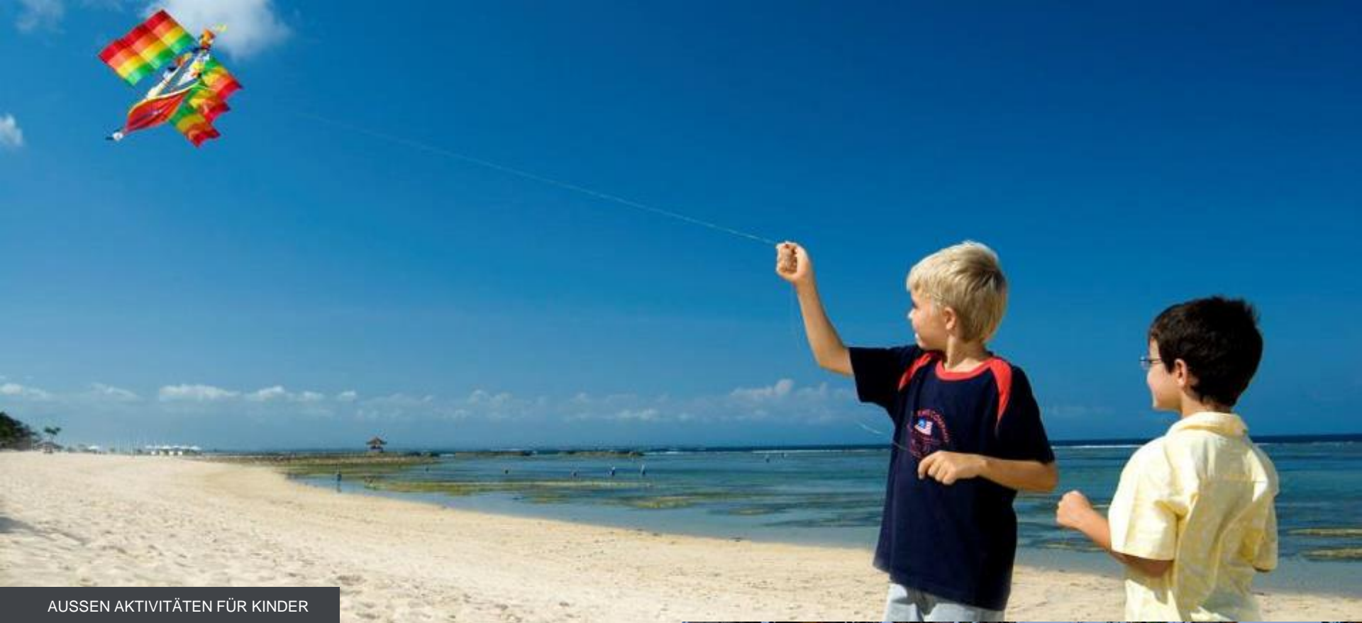
AUSSEN AKTIVITÄTEN FÜR KINDER