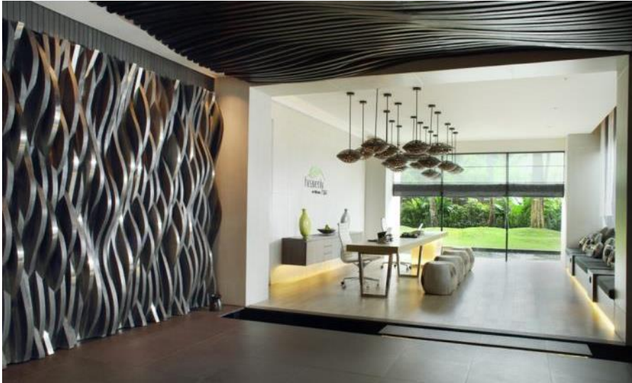
Heavenly Spa Rezeption