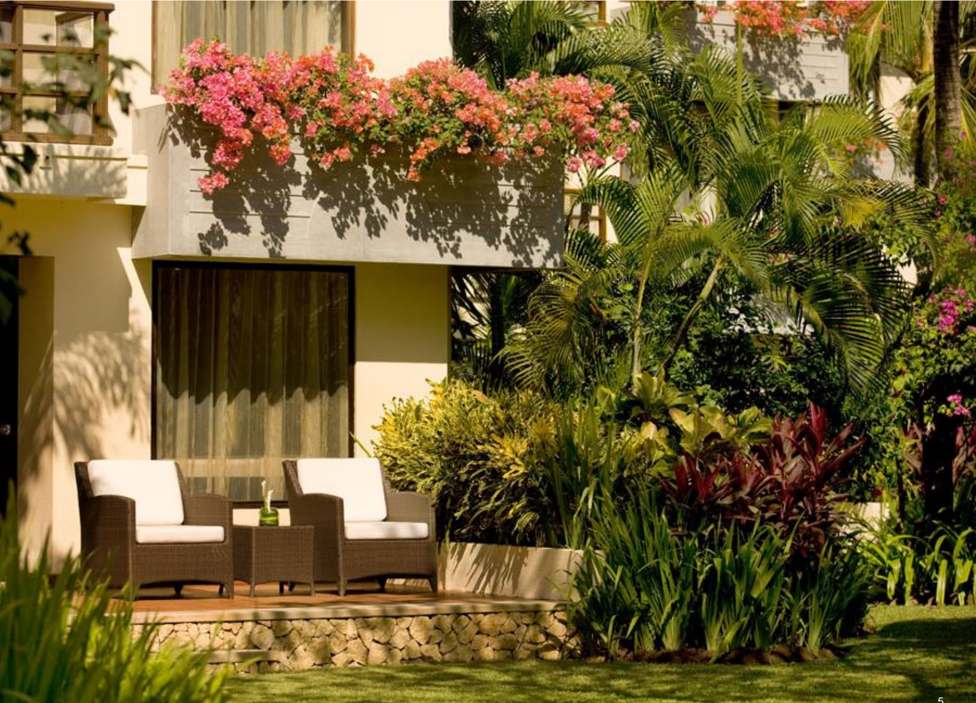
TERRASSE MIT TROPISCHEM GARTEN